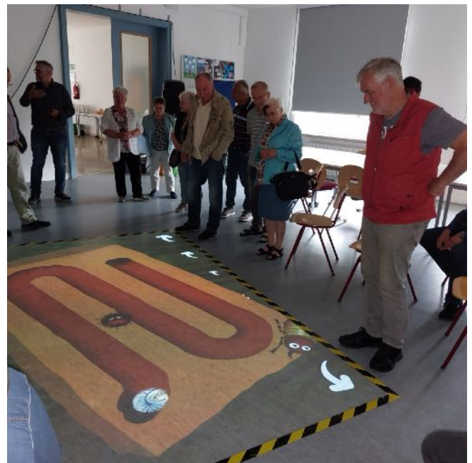
Abbildung 3: Die Teilnehmer am Magischen Teppich