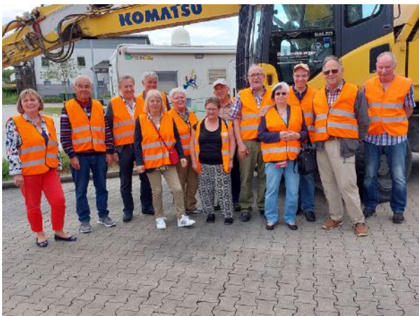
Abbildung 2: Teilnehmergruppe der IMV Kassel